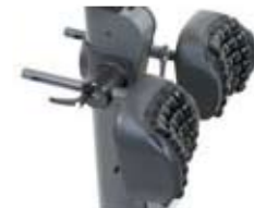
Delade knästöd (ROHO)