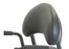
Rygg, Kroppsformad hög